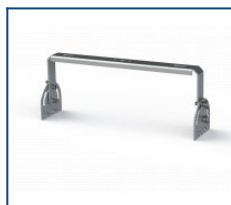
Кронштейн Лира Unit 90 (комплект)